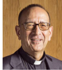
El cardenal Omella, nou president de la CEE